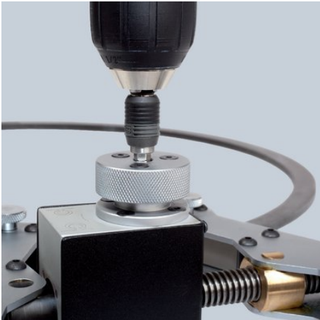
!Maschinell oder von Hand zu betätigen!